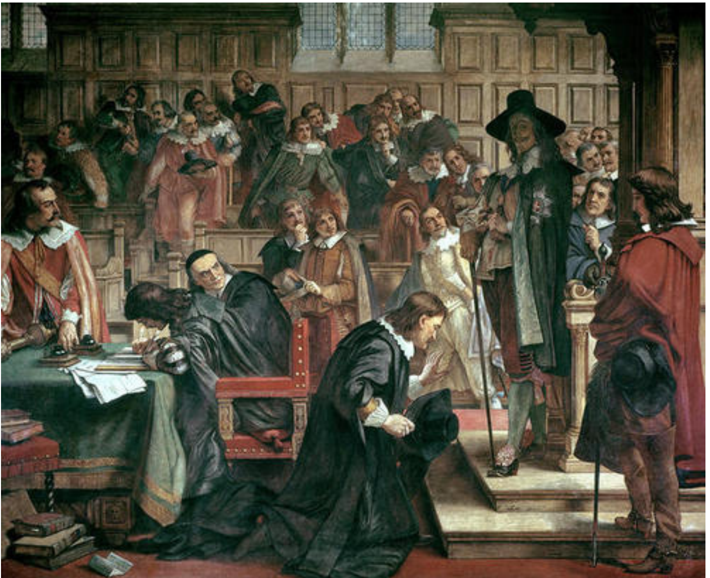
Delwedd gan Charles West Cope / Mae'r ddelwedd yma yn y parh cyhoeddus

Mae'r paentiad isod yn dangos yr ymgais i arestio'r 'pum aelod' gan Siarl I yn 1642. Defnyddiwch y paentiad i ddechrau trafodaeth ar y rhesymau pam ddechreuodd y Rhyfel Cartref yn 1642.